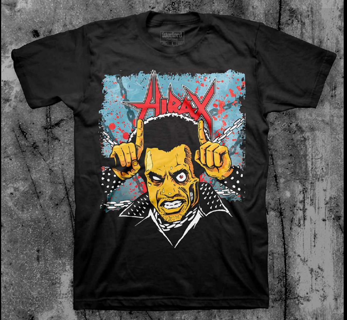
Polo oficial para la banda de thrash californiana HIRAX.