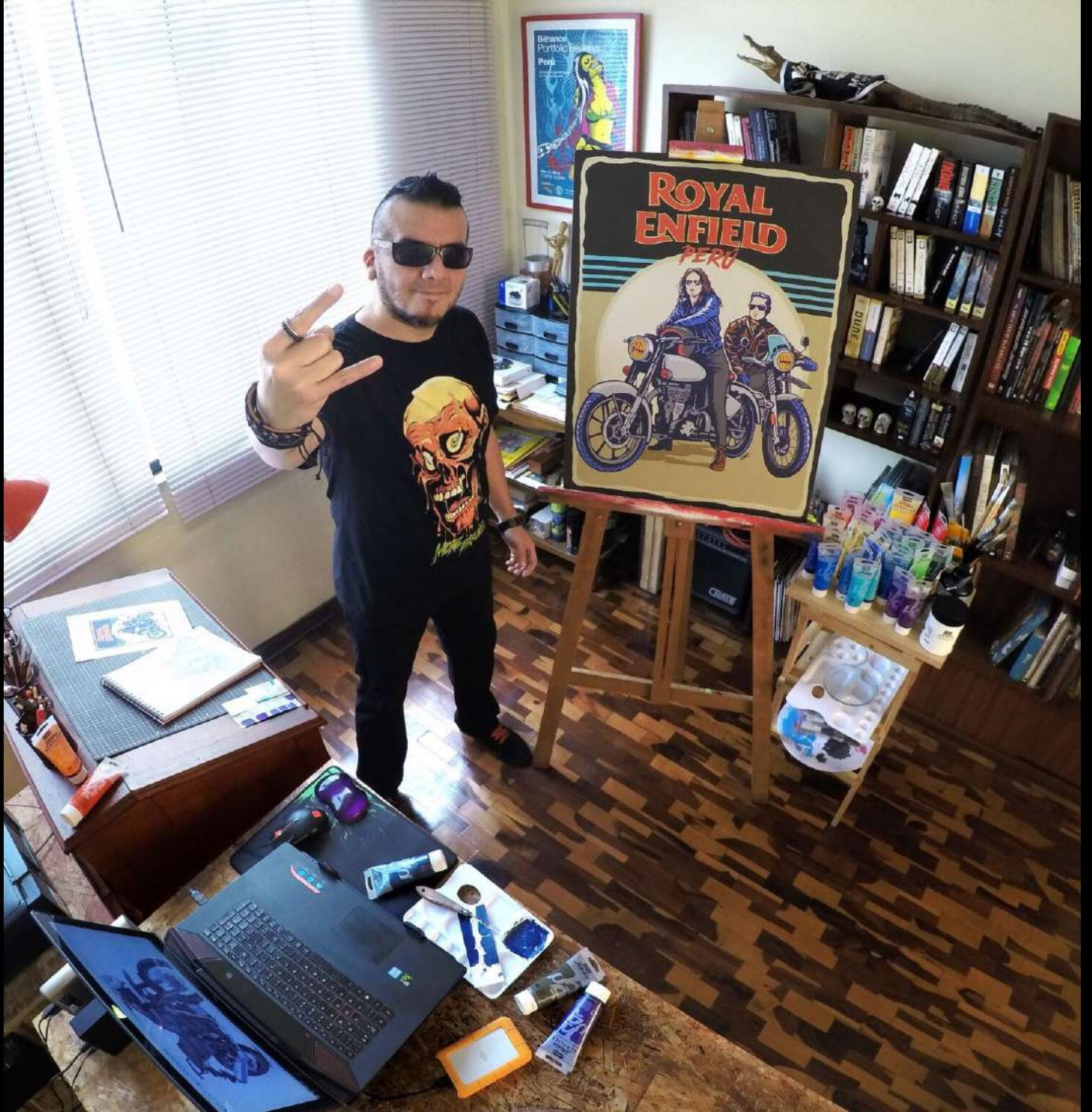
CORPZ y Royal Enfield