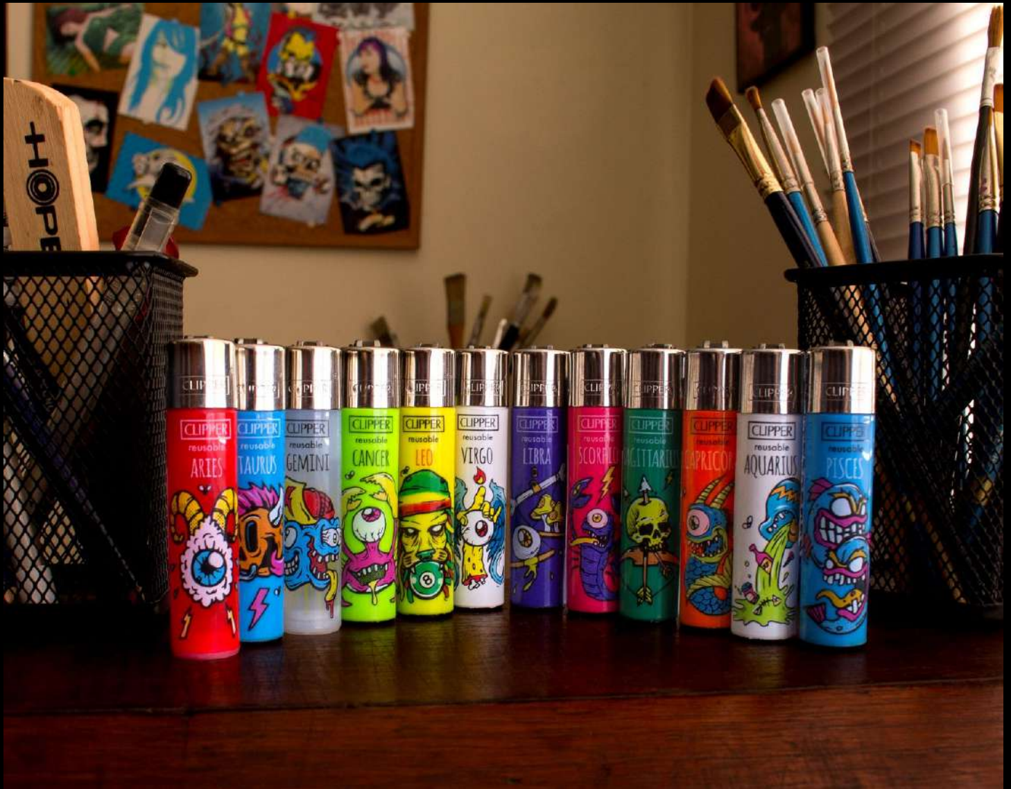
Diseños de CORPZ en los encendedores Clipper

Por el lado personal, estoy preparando una segunda colección de stickers (en este momento hay sticker-packs de una primera colección), también llevo preparando desde hace más de medio año una sorpresa con arte original para todos los que me siguen en redes, y finalmente estoy desarrollando una nueva serie de ilustraciones que estoy seguro se convertirán en mi próxima exposición individual.