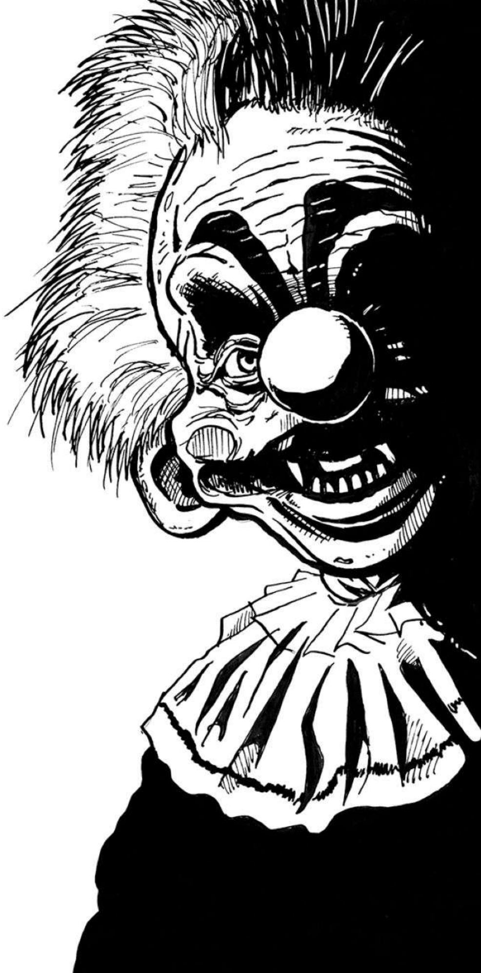
Ruddy the Clown